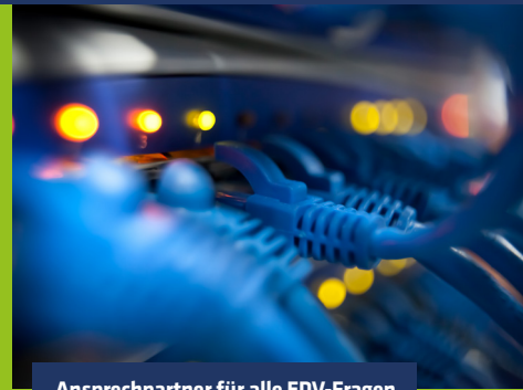
Ansprechpartner für alle EDV-Fragen

Wir suchen zur Verstärkung unseres Team ab 01.06.2022